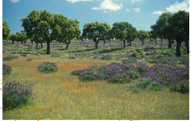
Quercus ilex L.