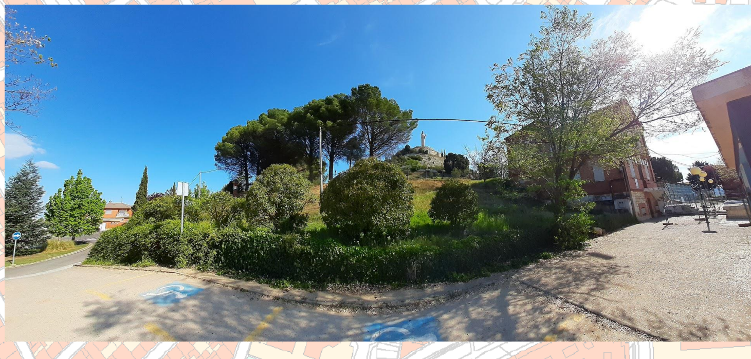
Imagen Final: Paisajes ecosistémicos, alternativa A, sin ronda