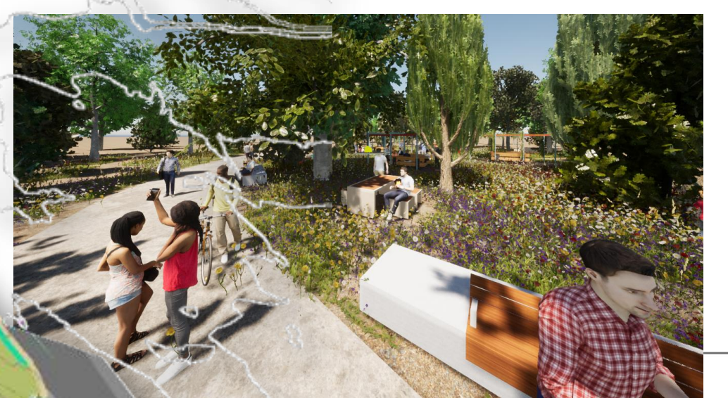
Imagen Final: Utopía, fases 07 a 11